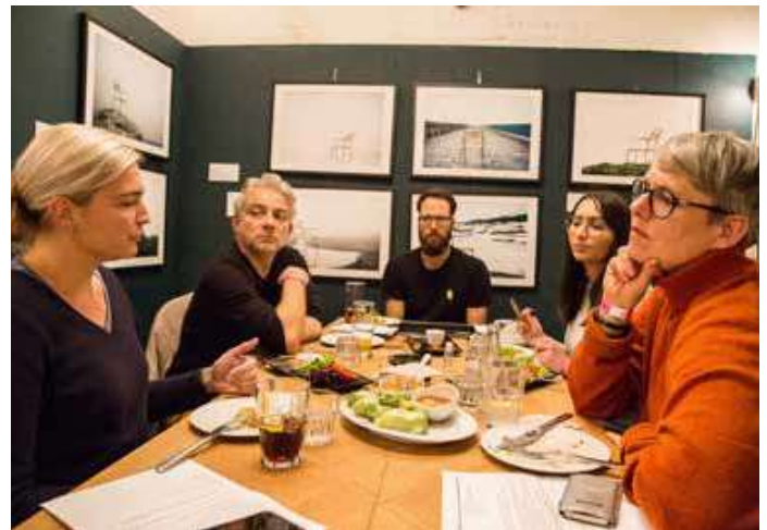
Die Gesprächsrunde am gedeckten Tisch im Restaurant «Klara».

Kontakt und Austausch mit der Schulleitung müssen regelmässig und institutionalisiert sein. Vor allem bei der Planung der Schulkonferenzen, aber nicht nur. Der KV ist eine Art privilegierter Austauschpartner der Schulleitung. Dafür braucht es Vertrauen und Kontinuität. Die Gefahr besteht, dass man die unterschiedlichen Rollen und Perspektiven vergisst. Es geht um konstruktive Zusammenarbeit zwischen KV und SL zum Wohl der Gesamtschule, aber der KV bleibt die Vertretung der Lehr- und Fachpersonen. Der KV hat keine Weisungsbefugnis oder Leitungsfunktion ausserhalb der Konferenz, er ist keine «erweiterte Schulleitung». Gerade bei Konflikten oder Auseinandersetzungen ist das wichtig: Rollen klären, Grenzen ziehen, Transparenz schaffen. Dissens muss man offen aussprechen und auf den Tisch legen können. Besonders bei der Schul- und Unterrichtsentwicklung muss der KV die Beteiligung des Kollegiums auch einfordern. Kollegium und KV sollen ihre Anliegen und Bedürfnisse formulieren und einbringen, zum Beispiel zu Form und Inhalt von gesamtschulischen Weiterbildungen. Bei ED-Befragungen wird manchmal nur die Schulleitung gefragt, aber die LP-Meinung muss auch erfragt werden. Auf lange Sicht ist echte Partizipation für alle Beteiligten, Schulleitungen wie Lehr- und Fachpersonen, entlastend und schafft Synergien, Vertrauen und Identifikation.